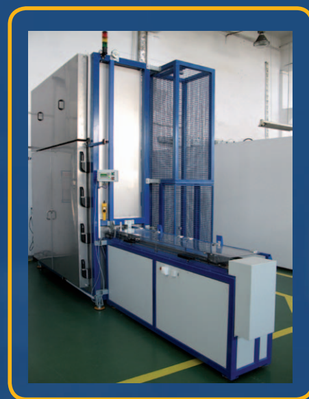
Widok ogólny stanowiska