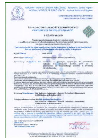
Produkt z atestem